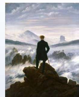
Caspar David Friedrich: Wanderer über dem Nebelmeer