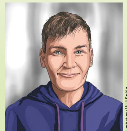
Illustration: Willi Spiring

Donnerstag, 5. März, Talk ab 19.30 Uhr, Bar offen ab 19.00 Uhr, Café am Puls